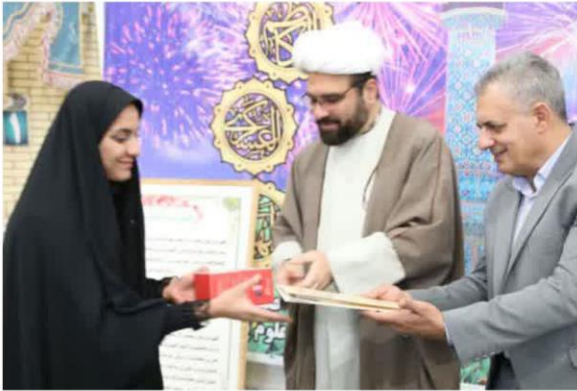
برگزاری آیین تجلیل و تقدیر از فعالین و خادمین عرصه نماز در دانشگاه علوم پزشکی فسا