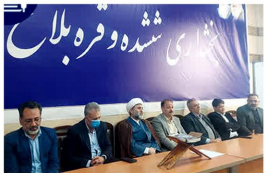
حضور دکتر پزشکی رییس دانشگاه علوم پزشکی فسا در شورای اداری بخش شده و قره بلاغ همزمان با دهه مبارک فجر انقلاب