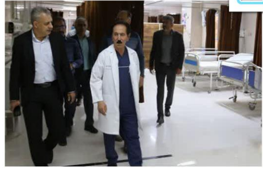
بازدید دکتر پزشکی رییس دانشگاه علوم پزشکی فسا از پروژه توسعه بخش اورژانس بیمارستان حضرت ولیعصر (عج)