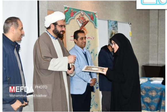
آیین تجلیل از مقام آوران قرآنی بیست و نهمین جشنواره قرآن و عترت و اولین جشنواره خانواده در دانشگاه علوم پزشکی فسا